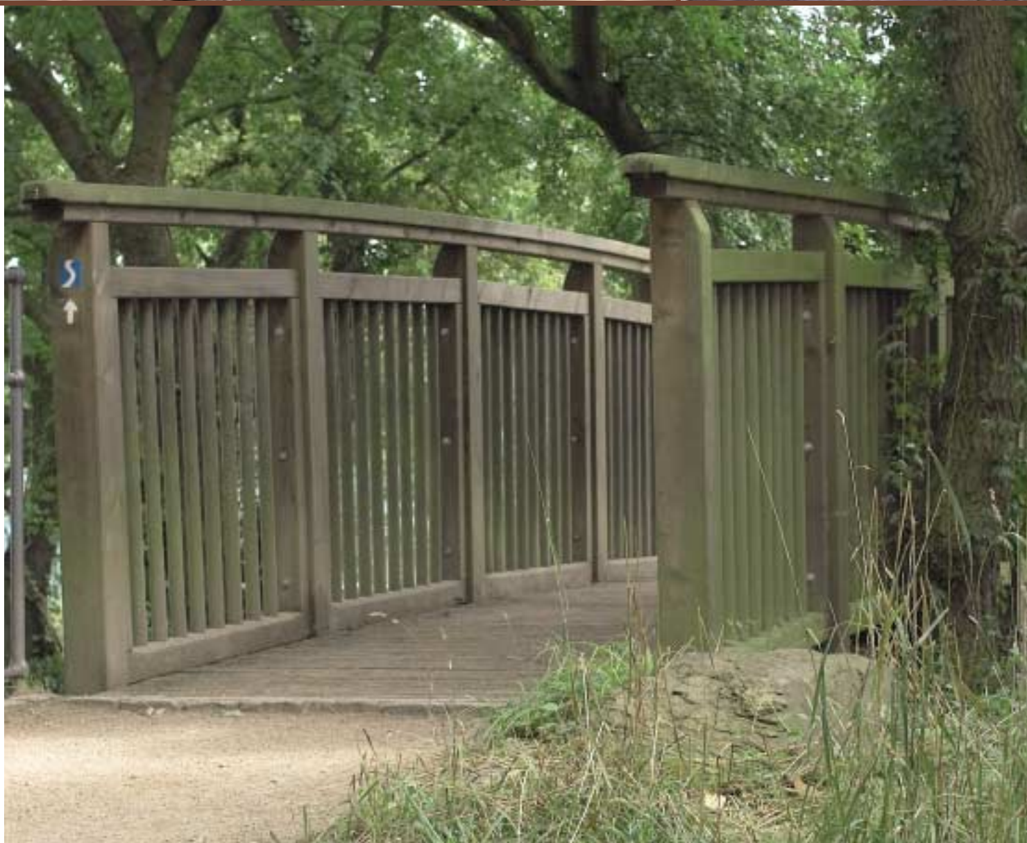
Une construction astucieuse et un design conforme au paysage «Made bei HOMBACH». Notre entreprise a construit ce pont de bois spécial, installé sur le plateau des rochers de Loreley. Il enjambe un ravin des rochers et offre une vue sur le fabuleux panorama du Rhin.